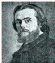
Леон Вальрас (1834–1910)

Раздел посвящен обсуждению основных предпосылок неоклассической экономической теории. Подробно анализируются допущения, связанные с поведенческими характеристиками экономических агентов, а также среда, в рамках которой они функционируют.